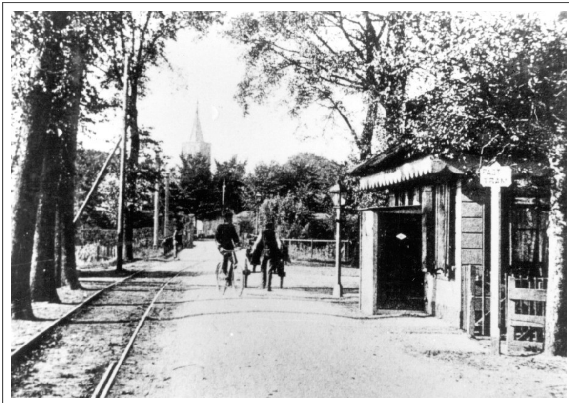
De Abri was een belangrijk knooppunt van twee tramlijnen in het Gooi. Op de foto de Amersfoortsestraatweg richting Vesting met het tramspoor Laren-Amsterdam. Rechts op de hoek van de Huizerstraatweg het toenmalige tolhuisje. Op dit punt moest de tram voorrang verlenen aan de tram van Bussum naar Huizen.