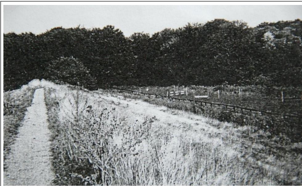
Voormalige Huizer los- en legplaats aan de Oostdijk.