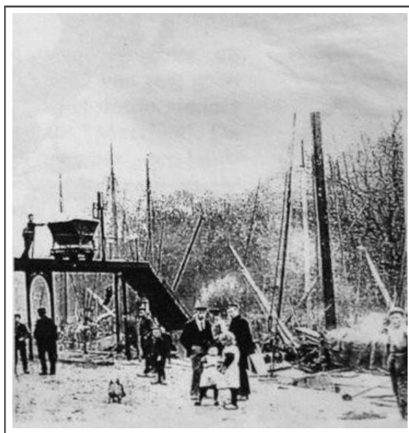
Foto links: de suikerfabriek in bedrijf. Links is een berg suikerbieten zichtbaar. Foto rechts: het lossen van suikerbieten op de kade bij de fabriek.

Een paar gebouwen van de voormalige Chemische Fabriek Naarden zijn in 1872 gebouwd voor de Gooische Beetwortel Suikerfabriek, die tot 1902 in bedrijf is geweest. De suikerbieten werden over het water aangevoerd. Een krantenbericht van 1893 maakt duidelijk hoeveel te krap die toevormogelijkheid was. Een groot aantal bietenschuiten lag afgemeerd in de buitengracht bij de Utrechtse Poort, wachtend op doorvaart naar de fabriek. 'Wel 70 masten staken boven de Vestingwallen uit.'