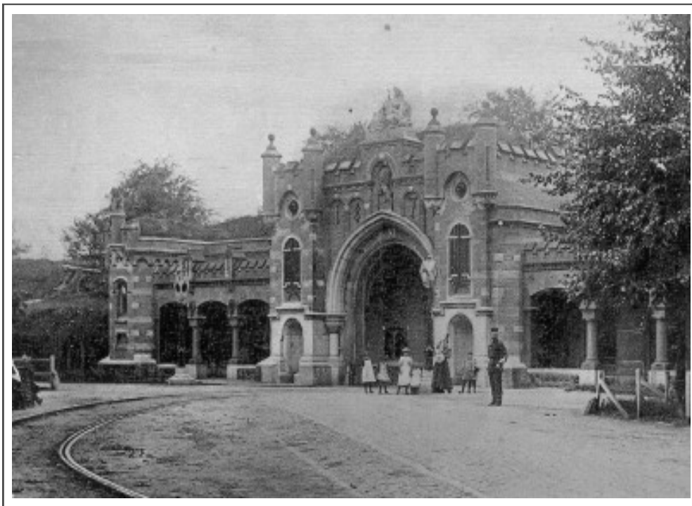
De Utrechtse Poort, gezien vanuit de stadzijde. Jaartal onbekend.

Bij de poort roeien we onder de oude brug door en slechts enkele halen daarna onder de nieuwe. Pas op, lage bruggen, dus allemaal bukken!