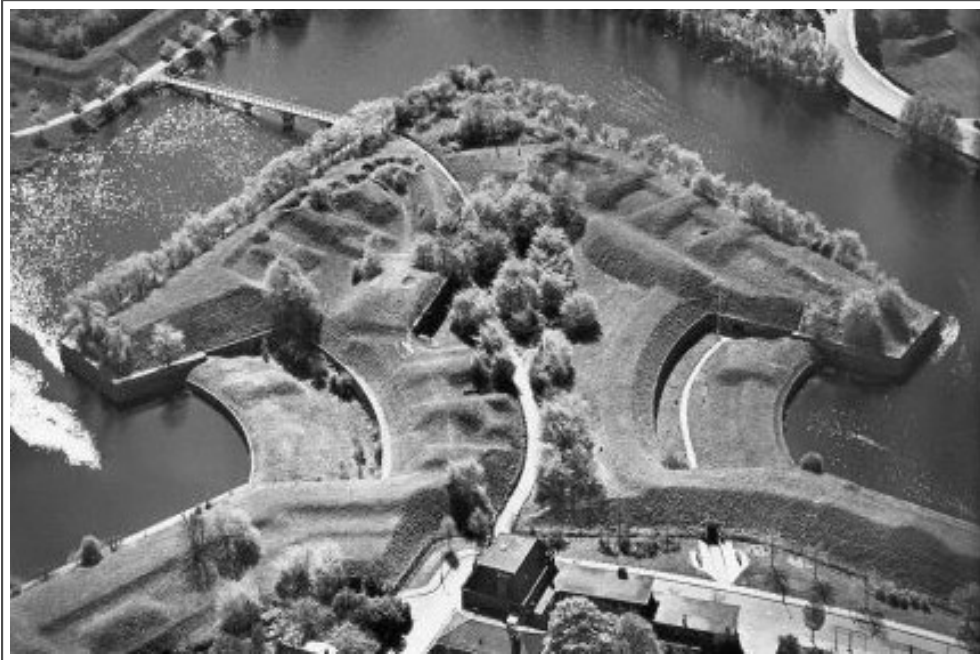
Gezicht op bastion Turfpoort met de Kippenbrug, ca. 1966.

Aan BB, onderaan het talud van de Bedekte Weg, is een heel klein restant van het bruggenhoofd nog te zien: paaltjes net boven de waterlijn, tegenover de linkerface van bastion Turfpoort.